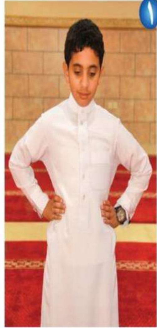
وضع اليدين على الخاصرتين