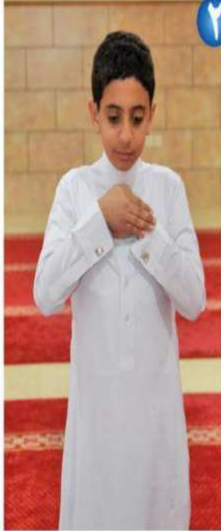
وضع اليدين أسفل العنق