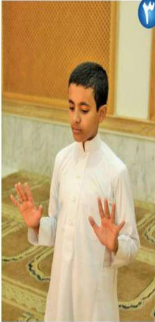
رفع البصر إلى السماء