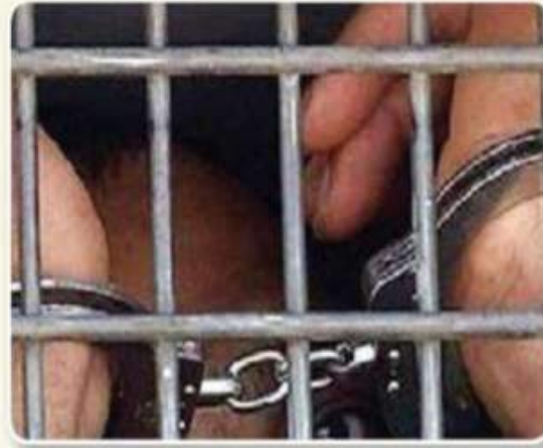
من آثار السرقة