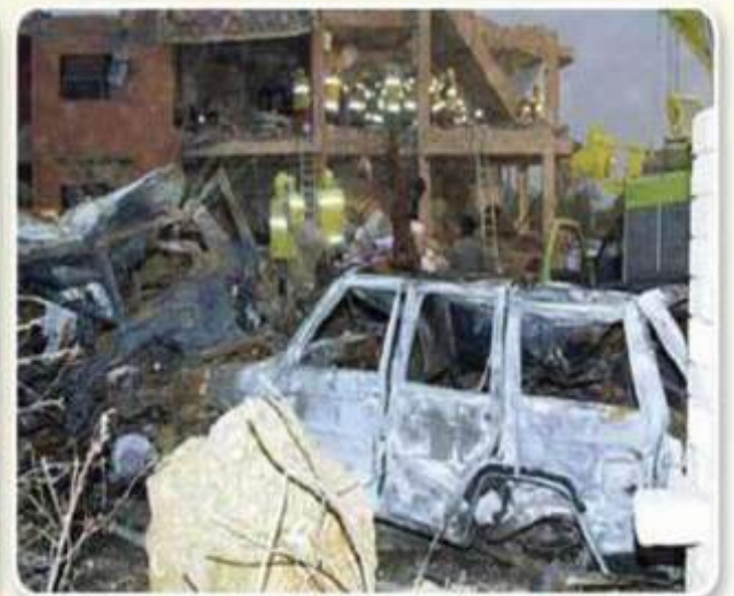
من آثار التفجيرات