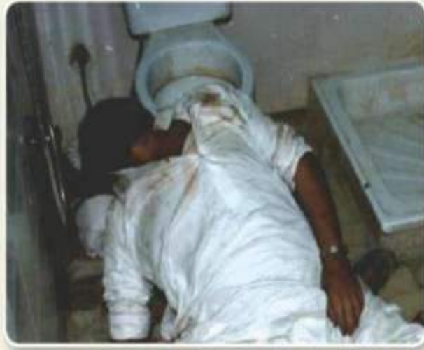
من آثار المخدرات