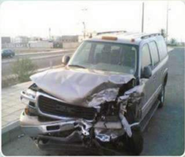
من آثار السرعة

أمامي صور لبعض الآثار التي خلفها من خالف ولي الأمر وأنظمة البلاد، أكتب أفضل تعليق على كل صورة.