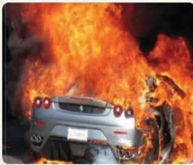
من آثار التفحيط