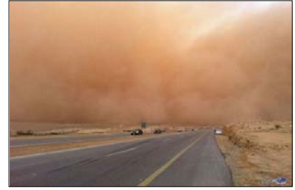
العاصفة ( ----- )