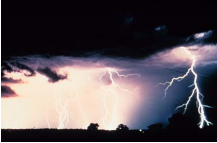
العاصفة ( ----- )

من خلال الصور الموضحة أمامك انكري نوع العاصفة: