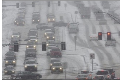
العاصفة ( ----- )