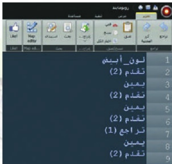
شكل (٤-٣-١): كتابة أوامر البرمجة لرسم الحرف (A)