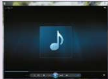
شكل (١-١-٤) برنامج ويندوز ميديا بلير

ستظهر شاشة مجلد (المستندات)، كما في الشكل (١-١-٤)، انقر نقرًا مزدوجًا على اسم الملف الذي حفظت فيه المقطع الصوتي.