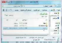
شكل (١-١-٤) نافذة فتح التسجيل

ستظهر شاشة مجلد (المستندات)، كما في الشكل (١-١-٤)، انقر نقرًا مزدوجًا على اسم الملف الذي حفظت فيه المقطع الصوتي.