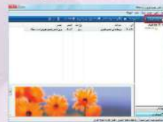
شكل (1-1-1) شاشة العمل للفاكس والمسح الضوئي بعد مسح ضوئي جيد

من قائمة (بدأ) ، أكتب في مربع البحث (الفاكس والمسح الضوئي)، وفي قائمة النتائج سوف يظهر برنامج (الفاكس والمسح الضوئي) لـ (Windows)) تحت قائمة البرامج، انقر على البرنامج كما في الشكل (1-1-1).