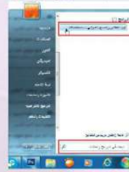
شكل (1-1-1) طريقة تحميل المسح الضوئي لـ (Windows)

أرفع غطاء الماسح الضوئي، وأضع الصورة أو المستند المطلوب نسخها - على زجاج الماسح الضوئي، حيث يكون جانب الطباعة نحو الأسفل، كما في الشكل (1-1-1)، مع مراعاة ضبط موقع الورقة بحسب الإرشادات الموجودة على حافة الزجاج. ثم أغلق غطاء الماسح الضوئي.