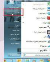
شكل (١-١-٤) الاستماع إلى الملف الصوتي الذي تم تسجيله

يمكنك توصيل جهاز صوت، أو فيديو آخر، أو كاميرا فيديو أو مثلث شرائط (كاسيت)، أو مثلث الأقراص المضغوطة CD، أو أقراص DVD، في منفذ الإخال على بطاقة الصوت، ويمكنه بعد ذلك تسجيل الصوت من ذلك الجهاز على الحاسب الخاص به باستخدام (محول الصوت).