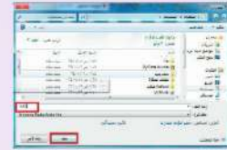
شكل (١-١-٤) نافذة فتح تسجيل الملف الصوتي في المستندات

تظهر شاشة مربع حوار حفظ التسجيل، كما في الشكل (١-١-٤). وفي خانة (اسم الملف)، أكتب اسماً للملف الصوتي الذي تم تسجيله، وليكن (test1)، ثم انقر فوق (حفظ) لحفظ الملف، وعندما سيتم حفظ الملف بصيغة امتداد (WMA) - وهي إحدى صيغ ملفات الأصوات - في مجلد (المستندات)، ويمكن حفظ الملف الصوتي في مجلد آخر بالنقر على اسم المجلد الذي أريد حفظ الملف فيه، أو حفظه في مجلد جديد بالنقر على (مجلد جديد).