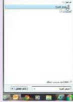
شكل (2-1) تشغيل برنامج مسجل الصوت

4 سوف تظهر شاشة البرنامج كما في الشكل (3-1).