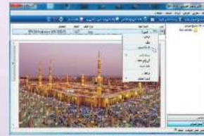
شكل (1-1-2) تغيير اسم الملف الافتراضي الخاص بالصورة التي تم مسحها ضوئياً، انقر بزر الفأرة الأيمن فوق اسم المستند في طريقة العرض (مسح ضوئي) ثم انقر فوق إعادة تسمية، كما في الشكل (1-1-1).

✓ انقر فوق مسح ضوئي، ثم أنتظر بضع ثوانٍ حتى يتم المسح بشكل كامل، وعندما يتم حفظ المستند الذي تم مسحه بالماوس (تلقائياً) في المجلد (المستندات)، تحت (المستندات الملتصقة بالماوس الضوئي)، كما في الشكل (1-1-1).