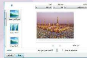
شكل (1-1-3) مربع حوار (طباعة الصور) لطباعة المستند الذي تم مسحه

Ⓐ عند رغبتك في تغيير اسم الملف الافتراضي الخاص بالمستند أو الصورة التي تم مسحها ضوئياً، انقر بزر الفأرة الأيمن فوق اسم المستند في طريقة العرض (مسح ضوئي) ثم انقر فوق إعادة تسمية، كما في الشكل (1-1-1).