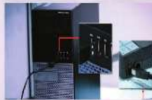
شكل (١-١-٤) توصيل الماسح الضوئي بالحاسب

أحد الماسح الضوئي بالحاسب، ومصدر التيار الكهربائي (بعض الماسحات الضوئية لا تحتاج لمصدر تيار كهربائي)، كما في الشكل (١-١-٤).