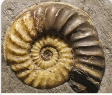
الشكل 5-8 أحفورة الأمونيت إحدى الأحافير المرشدة البحرية التي ميزت الحقبة المتوسطة.

الحقب Eras تتكون جميع الدهور من حقب، والحقبة Era هي ثاني أكبر وحدة زمنية، وتتراوح بين عشرات إلى مئات ملايين السنين. وتُحدّد الحقبة - كما تُحدّد بقرية الوحدات الأخرى - بناء على أنواع الحياة المختلفة التي نجدها في الصخور. أما أسماء الحقب فهي مشتقة من كلمات إغريقية بُنيت على الأعمار النسبية لأشكال الحياة. فعلى سبيل المثال كلمة paleo تعني قديماً، وكلمة meso تعني متوسطاً، وكلمة ceno تعني حديثاً، وكلمة zoic تعني الحياة، لذا فإن Paleozoic تعني الحياة القديمة، و Mesozoic تعني الحياة المتوسطة، و Cenozoic تعني الحياة الحديثة.